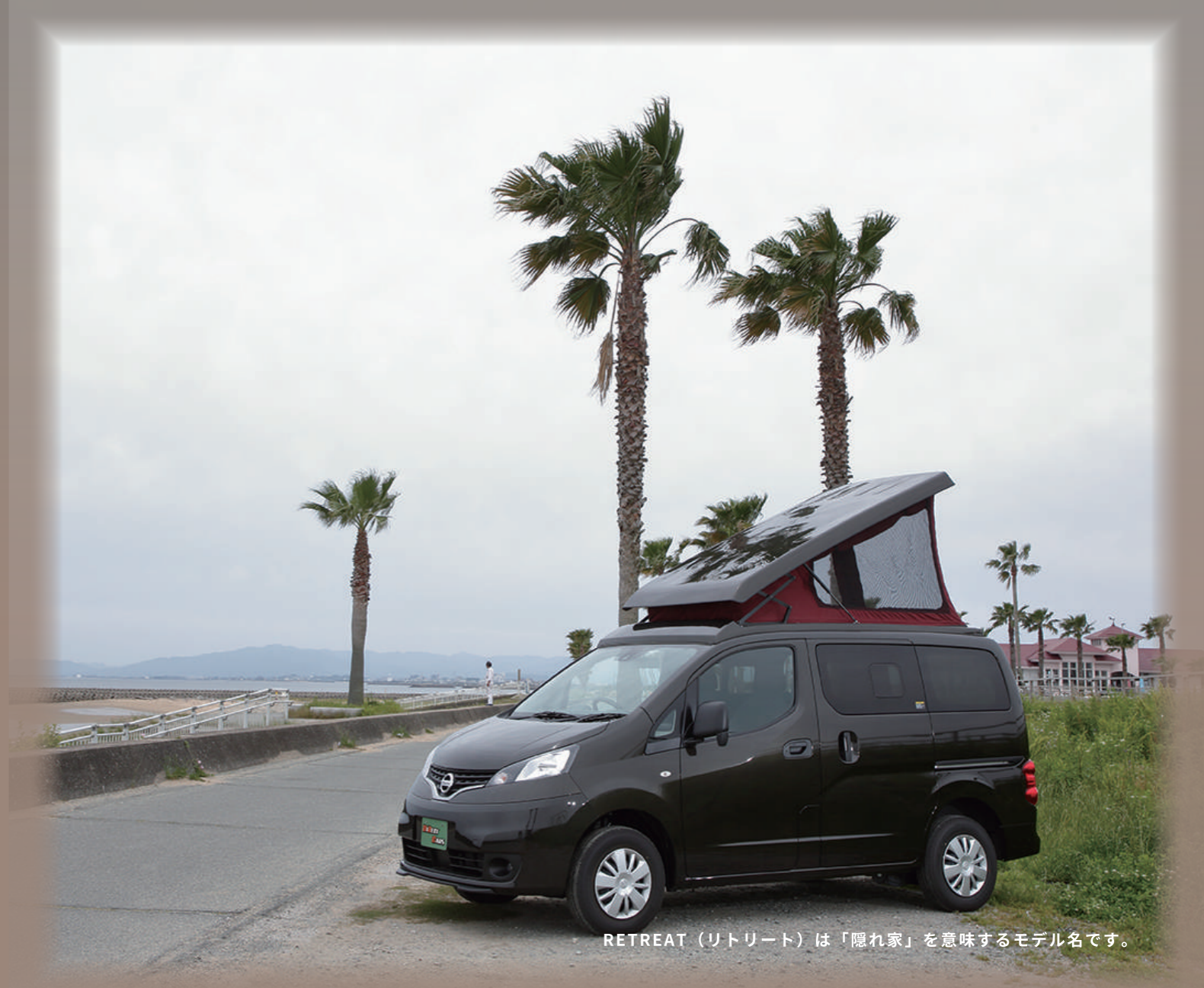
RETREAT (リトリート) は「隠れ家」を意味するモデル名です。