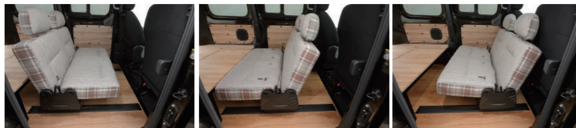
展開方法がわかりやすい FWS シートを採用。2人掛けの前向き&後ろ向きポジション、フルフラットモードへの展開が容易です。

ポップアップルーフには虫の侵入を防ぐ網戸を装備。高原などでのキャンプでも快適にお過ごしいただけます。